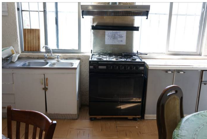
Cocina Módulo 1