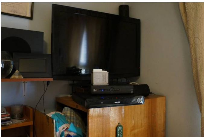
Televisión satelital celda individual Módulo 1