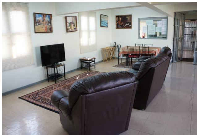
Sala de estar Módulo 3

Los módulos también tienen salas de estar bien amobladas, cómodas y espaciaosas, debiendo señalarse que todo el mobiliario fue aportado por los internos. Los comedores comunes se encuentran bien equipados y cuentan con refrigeradores, cocina, hornos, hornos microondas, entre otros.