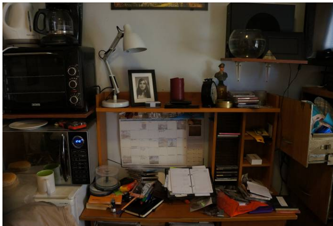
Escritorio celda individual y electrodomésticos Módulo 1