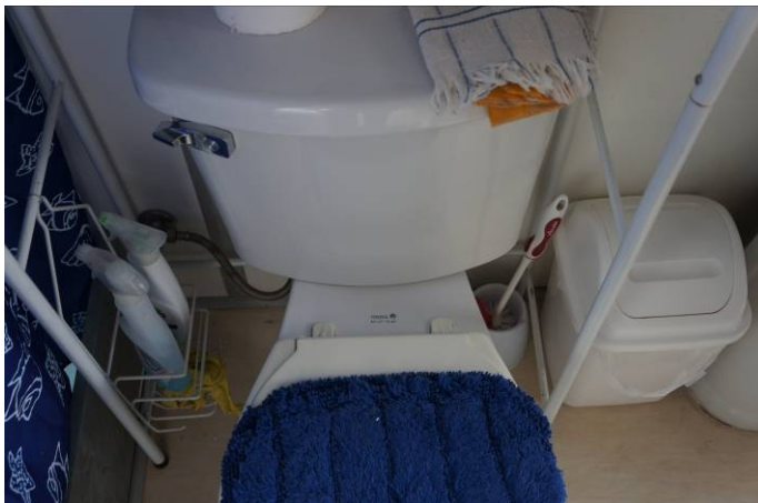
Baño celdas de la zona de "contenedores"