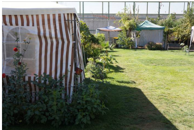
Instalaciones para recibir a la visita patio Módulo 1