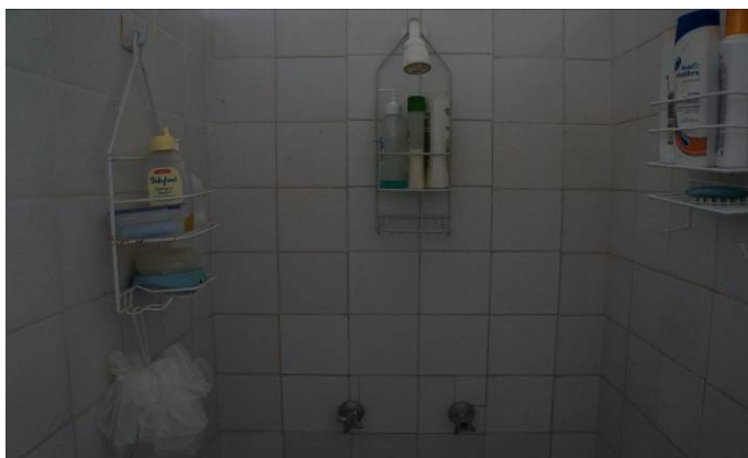
Duchas zona de duchas Módulo 3