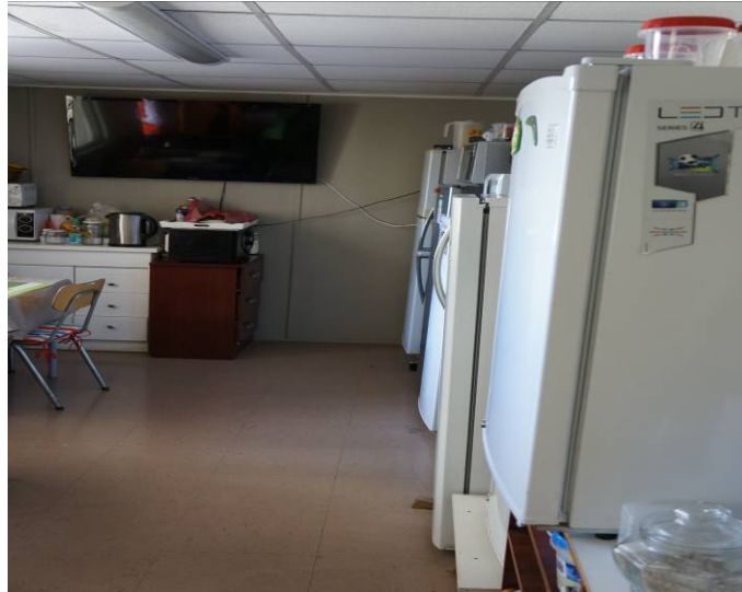
Electrodomésticos de la cocina/comedor Zona de "contenedores"