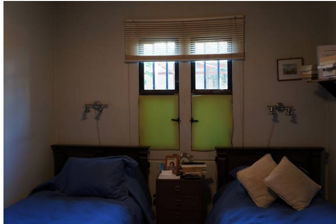
Celda compartida módulo 1

con televisión satelital -Direct TV-, frigobares, dvd's, calefactores, hornos y hornos microondas, equipos de música, cafeteras eléctricas, lavadoras, entre otros).