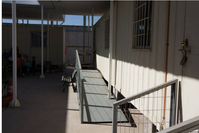
Zona Módulos contenedores

Uno de los contenedores está acondicionado como cocina y comedor. Al igual que las cocinas/comedor de los módulos, están bien equipadas con artefactos electrodomésticos y mobiliario. Los contenedores tienen rampas y barandas adecuadas para su acceso.