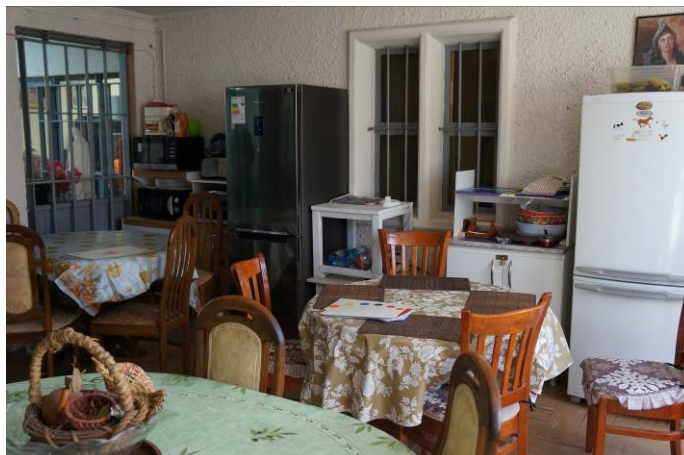
Muebles de cocina, artefactos eléctricos y comedor Módulo 1