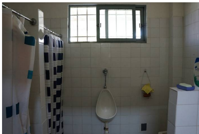
Urinario zona de duchas Módulo 3

Respecto de las duchas comunes de los módulos, en general éstas se encuentran en buenas condiciones de ventilación, luminosidad, mantenimiento e higiene, a excepción de las duchas del módulo 1, en donde faltaban algunos azulejos del suelo y la pared, y en la que se pudo observar unas pocas manchas amarillas, aparentemente producto de la corrosión y hongos. Todas las duchas funcionaban correctamente, no advirtiéndose problemas de filtración de agua. En ellas había disponible agua caliente 2 . Las dependencias de las duchas se aprovechan para poner las lavadoras de los internos.