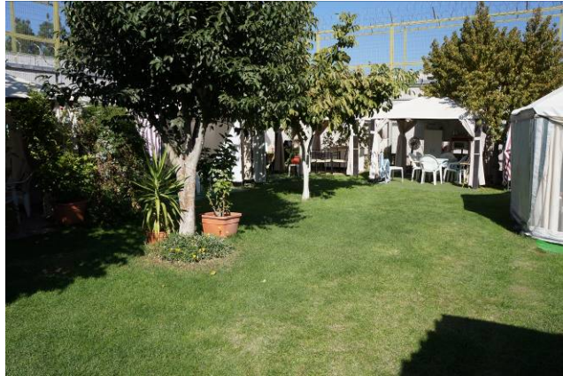
Patio Módulo 3