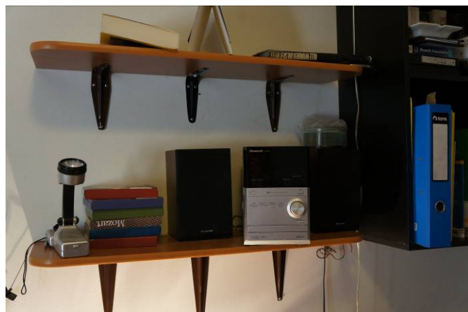
Biblioteca celda individual Módulo 1