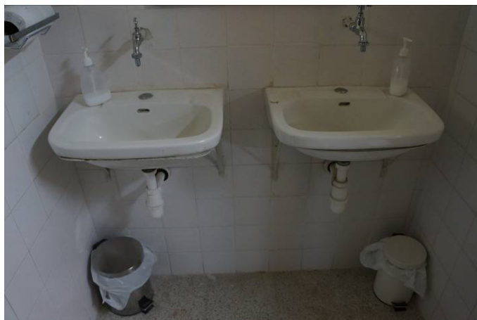
Lavamanos zona de duchas Módulo 3