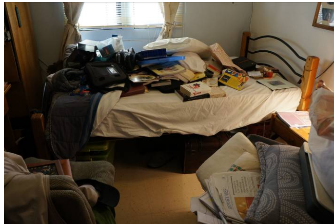
Celda individual Módulo 1 después de allanamiento.