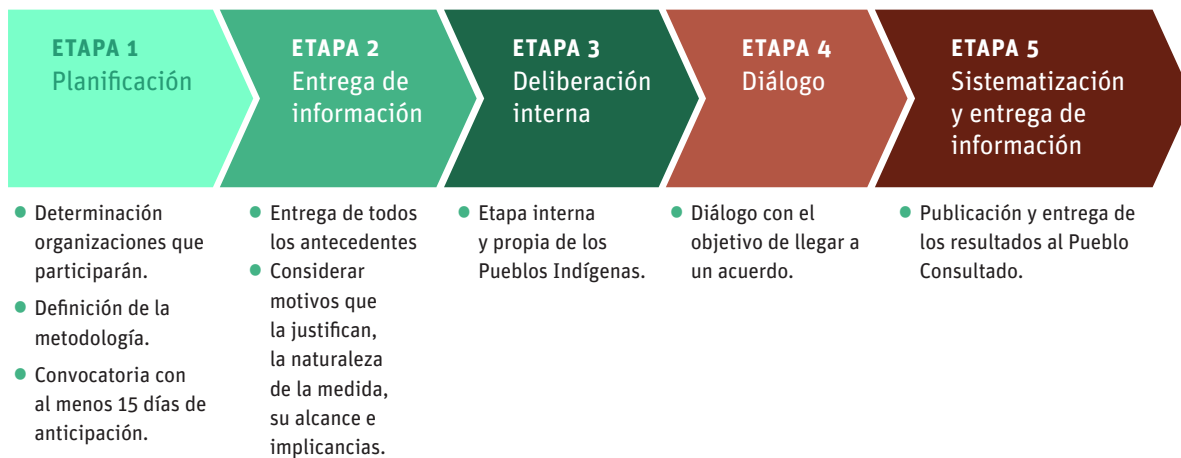
CUADRO 1_ Etapas del Procedimiento de Consulta