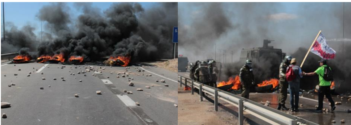
Actuación de Fuerzas Especiales en protesta con corte de Ruta 5 Norte y barricadas en el km. 668, a la altura de Vallenar.

En cuanto a la intervención policial, el Intendente Regional agrega que “ha estado ajustada a derecho, porque cuando tienes tomas de caminos para impedir las labores productivas y la libre circulación, cuando hay tomas de edificios públicos como la Gobernación Provincial de Chañaral o la agresión a la Gobernadora de Huasco, es evidente que la fuerza pública tiene que intervenir, pues tiene la obligación de garantizar el orden público, esa es su tarea. Yo no tengo ningún reparo respecto del proceder que ha tenido Carabineros en estas instancias”.