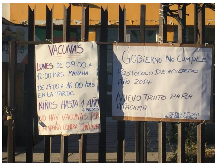
Cartel en el frontis del CESFAM de Vallenar con los horarios y población a vacunar, 12 de abril de 2016.