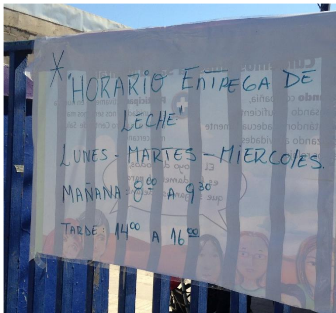
Cartel en el frontis del CESFAM de Copiapó con el horario para la entrega de leche, 12 de abril de 2016.