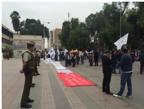
Manifestantes y resguardo policial en el frente de la Intendencia, marcha 11 de abril de 2016, Copiapó.