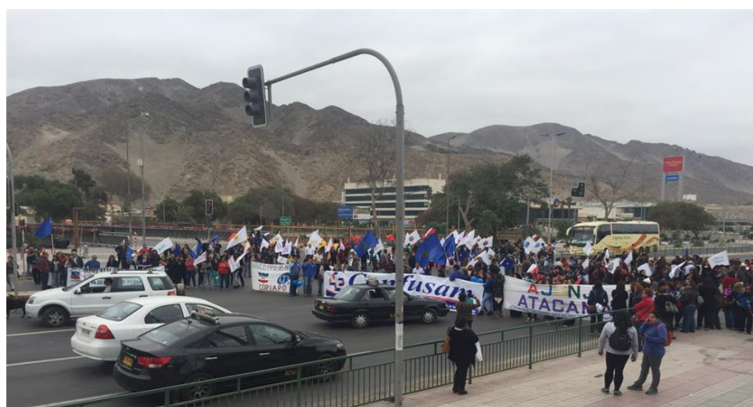
Corte de tránsito por parte de manifestantes en la esquina de Ruta 5 Norte y Chacabuco. Marcha 11 de abril de 2016, Copiapó.