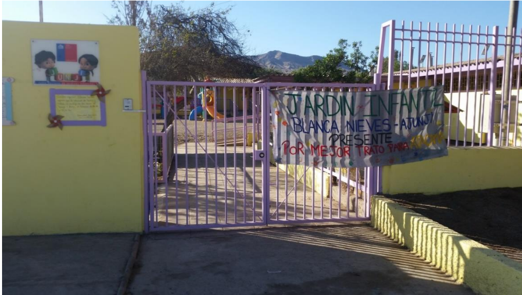
Jardín infantil Blanca Nieves (JUNJI) de Chañaral cerrado por la paralización, 12 de abril de 2016.