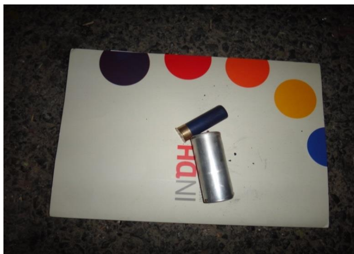
Sector Localidad de Portones.

De los variados testimonios recogidos durante la Misión, que incluyó a autoridades comunales, dirigentes locales y participantes en las manifestaciones, puede desprenderse que respecto de la actuación policial no hubo gradualidad en la intervención policial, la que contempló desde su inicio el despliegue de todos sus elementos disuasivos, especialmente gases lacrimógenos y escopetas antimotines con perdigones de goma.