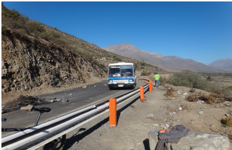
Sector La Junta

El origen de la movilización para la empresa fue una sorpresa 23 . Para ellos existía un referente social difuso, liderado por dos dirigentes con los que la Empresa ha venido conversando y desarrollando muchas acciones y que son de la comunidad de Chillepín. El gerente entrevistado es consciente que dichos dirigentes y pobladores hace tiempo demandan un pronunciamiento para que la empresa use agua de mar en los procesos mineros para restituir las aguas de la cuenca.