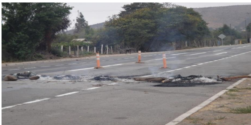
Entrada Salamanca

La movilización consistió básicamente en la ocupación e interrupción de la ruta que une la ciudad de Salamanca con las faenas mineras, manteniendo el control un grupo de pobladores en diversos puntos de la ruta con el objeto de impedir el tránsito de vehículos de propiedad de la empresa. Para cualquier otro vehículo hubo libre tránsito.