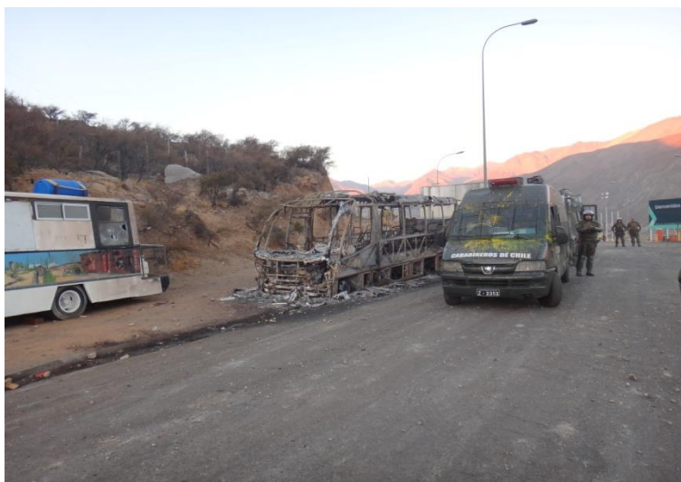
Localidad de Portones Ingreso a las faenas. Día 5 de marzo en la tarde.

Este acuerdo fue precedido de una intensa movilización social cuyo punto más álgido se vivió la tarde/noche del día 4 y la madrugada del día 5 de marzo del año en curso, con el desarrollo de un operativo policial, calificado de inédito por los diversos actores entrevistados (Alcalde; dirigentes y pobladores entrevistados), por el uso de vehículos blindados, helicópteros y otros medios disuasivos utilizados profusamente y que no habían sido vistos en el valle a pesar de la historia de movilizaciones que este tiene. Los incidentes más graves se concentraron en la ruta que une Salamanca con Portones, lugar de ingreso a Minera Pelambres.