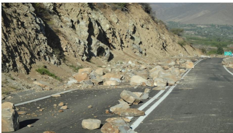
Misión de Observación. Camino a Pelambres