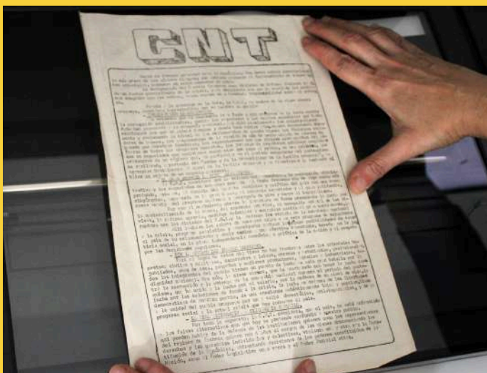
Digitalización de documento usando un escáner de cama plana

Las consideraciones sobre la importancia del acceso al conocimiento y el manejo ético de la información se integran como temas transversales.