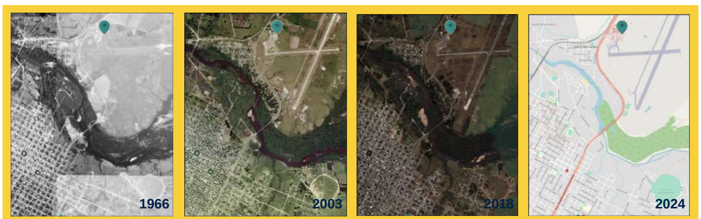
Fotografías aéreas, imágenes satelitales y mapa de calles en sitiosdememoria.uy .

Para los mapas (conformados por fotografías satelitales, aéreas o información vectorial como calles), donde se visualiza la georreferenciación de espacios represivos, es preferible usar capas con licencias libres. Asimismo, existen iniciativas en muchos países de fotografías aéreas históricas que pueden ser incluidas como una capa adicional para apreciar los cambios temporales en los territorios.