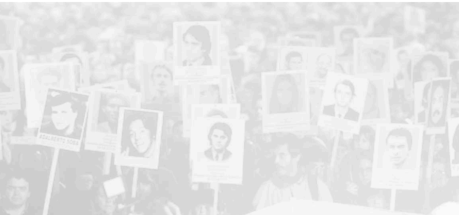
Marcha del Silencio (Uruguay)

La experiencia plasmada en este manual, surge del trabajo desarrollado, el cual no hubiera sido posible sin el aporte generoso y comprometido de muchas personas y organizaciones de víctimas, familiares y militantes que aportan sus documentos, informaciones y testimonios. A estas personas, muchas de las cuales integran la red de apoyo del proyecto plancondor.org nuestro agradecimiento.