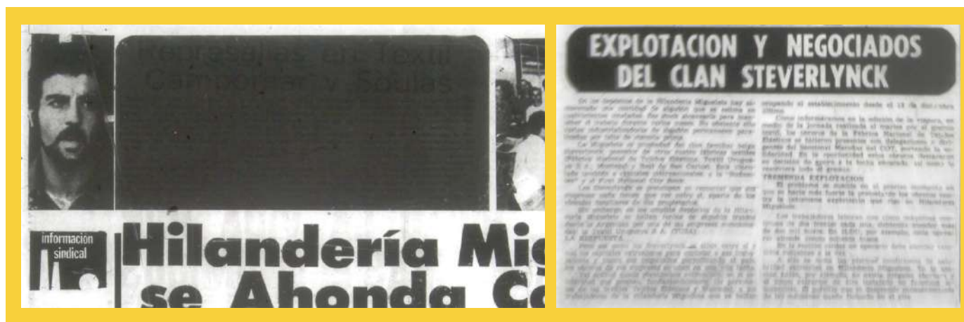
Resultados de digitalizaciones con equipamiento y parámetros incorrectos Periódico "El Popular" (Uruguay, 1973)

Los proyectos de digitalización requieren, previo a la inversión, una evaluación detallada de cuáles serían los equipos apropiados para los objetivos de la tarea propuesta. De esta forma, se evita la necesidad de afrontar gastos imprevistos o indirectos que pueden llegar a condicionar los resultados e incluso obligar a realizar nuevas digitalizaciones, parciales o totales, con la extensión de los plazos de trabajo.