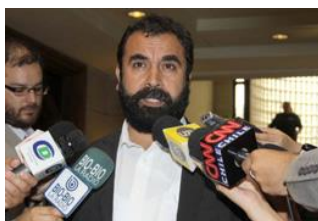
Diputado Hugo Gutiérrez