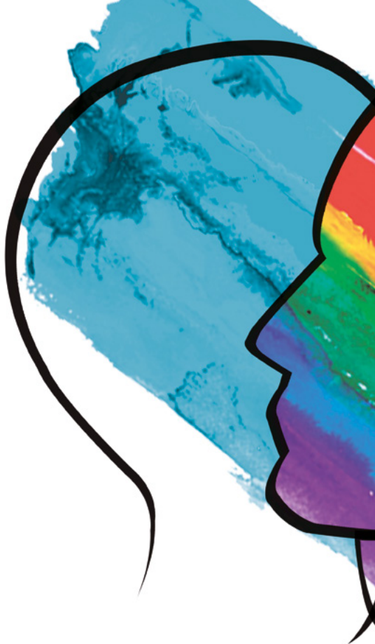
Imagen portada e interiores: Afiche “Siluetas sobrepuestas”, de Cecilia Guzmán Opazo presentado al Concurso Nacional Arte y Derechos Humanos 2015